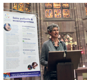
▲ Concert pour le 20 ans de l'USP

La Fondation Atrium a attribué une subvention de 10000 euros au secteur Enfance, plusieurs projets exceptionnels ont ainsi pu se concrétiser.