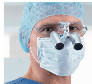
▲ Matériel microscopique

À la clinique Sainte-Barbe, le 20 avril 2017, deux chirurgiens (ORL et maxillo-facial) ont réalisé une reconstruction mandibulaire après exérèse carcinologique ; cette opération fut une première dans un établissement privé alsacien ! La microchirurgie pour la reconstruction des patients traités en oncologie est une activité en plein développement au Groupe Hospitalier Saint-Vincent et requiert un équipement technologique particulier ; en 2017, c'est un matériel microscopique qui a pu être acheté grâce à un don.