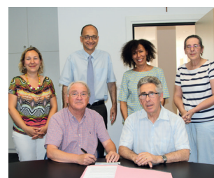
▲ Signature de la convention avec Logiservices

En 2017, à Montigny-Lès-Metz, l'aménagement du futur « Jardin de Vie » est un projet fortement soutenu.