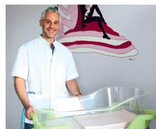
▲ Le berceau à hauteur variable

Et à la maternité, un berceau pour nouveau-né à hauteur variable hydraulique a été offert par la société Le carré médical.