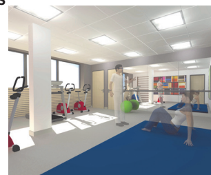
▲ Le futur Centre « Mieux-Être »

À la clinique Sainte-Anne, particuliers et associations se mobilisent au profit du futur Centre « Mieux-Être » du nouveau centre d'hémodialyse. Toujours fidèle, l'association Force et Courage agit et cette année, la troupe de théâtre « Richstetter Bâsetheatre » a elle aussi fait un don pour l'aménagement de cet espace qui répondra à trois objectifs : le réentraînement à l'effort, l'éducation thérapeutique, le dépistage des patients chuteurs.